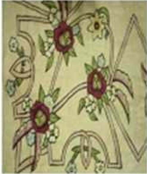
Kalem işi tekniği ile desenlendirilmiş bir örtü detayı

Yazmacılık sanatında kumaşı desenlemek için 3 farklı teknik kullanılmaktadır. Bunlar; 1-Kalem işi tekniği, 2-Kalem işi- Kalıp tekniği, 3-Kalıp tekniğidir.