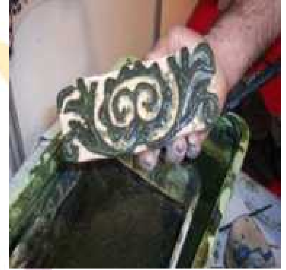
Baskı kalıbının renklendirilmesi