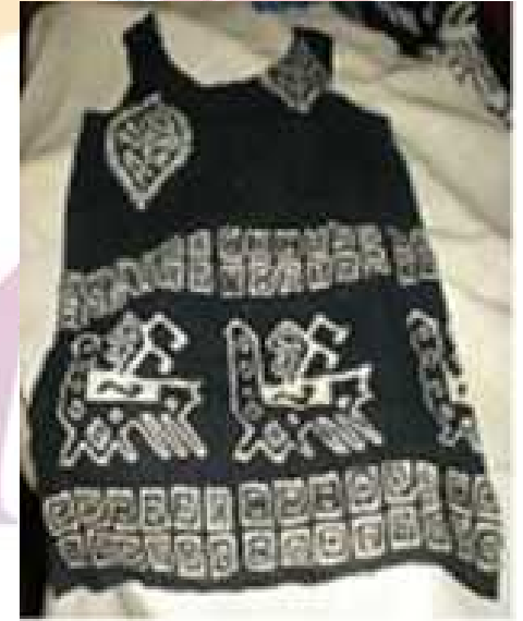
Ařındırma tekniđi ile renklendirilmiş yazma bluz

Kumařın desenleme işlemleri tamamlandıktan sonra kireç baskılı kumař 24 saat bekletilir. Daha sonra bol su ile yıkanıp durulanır. Kirecin temas ettiđi kısımlarda kumař beyaz bir renk alır böylece siyah kumař üzerine beyaz desenler ortaya çıkar.