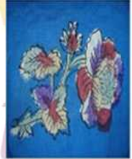
Mavi ağartma tekniđi ile renklendirilmiş başörtüsünden detay

Sarı renkli astar boyası, desen konturlarının içine üzeri keçelenmiş lap kalıp ile basılır. Baskı yapılan kısımlar yeşile döner. Daha sonra kitre katılmış ecza boyası ile yeşil alanlara baskı yapılır ve ortaya altın gibi parlayan sarı bir renk çıkar. Bez üzerindeki boya kurumaya başlayınca yavaş yavaş kızarır, tam kurumadan havuzlarda yıkanır. Kızaran alanlardaki boya akar ve kontur içleri süt beyaz olur. Kurutulan bezlerin beyaz kalan yerlerine istenilen renkte elvan baskı yapılarak yazma tamamlanır.