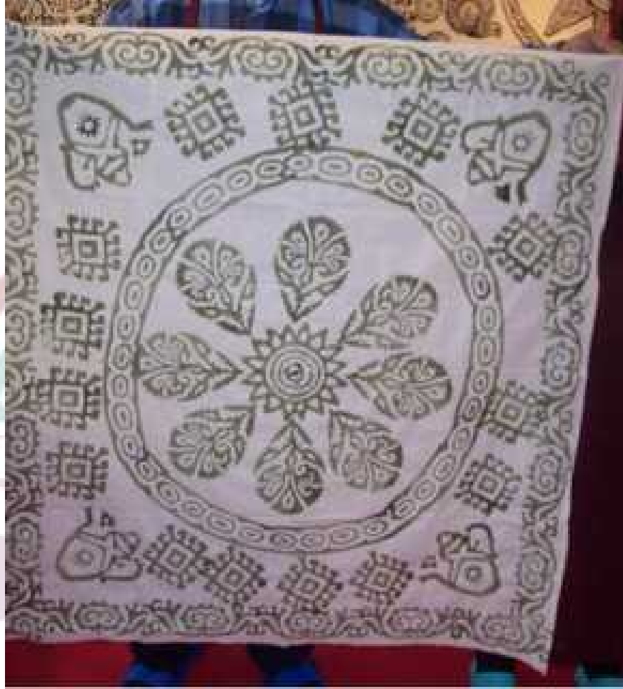
Baskı ustası Cemil Kızılkaya'nın kalıp tekniği ile yaptığı ağaç baskı yazma örneği