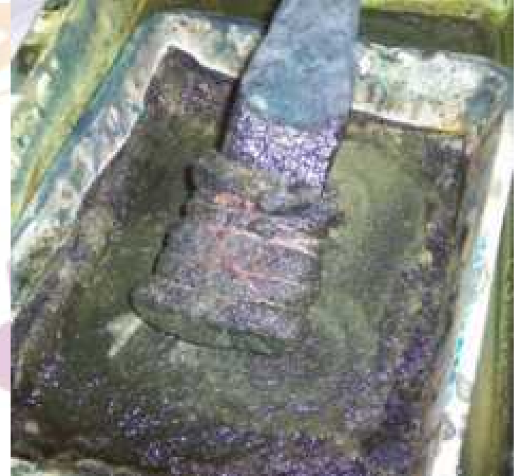
Boya teknesi ve yağlangıç

Yağlangıç, tahta sap ucuna ipe sarılarak tutturulmuş keçe parçasıdır. Boya teknesindeki keçenin boya miktarı azaldıkça teknedeki kalıba geçen boya yetersiz kalır ve desen net basılamaz. Bunu önlemek için keçe üzerine belirli aralıklarla alt teknedeki boya aktarmak gerekir. Bu işlem 'Yağlangıç' ile gerçekleştirilir.