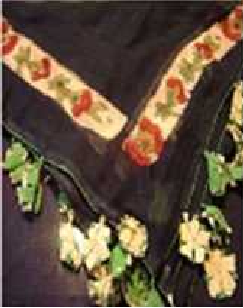
Daldırma tekniği ile renklendirilmiş başörtüsünden detay

Kumaşın desenleme işlemi tamamlandıktan sonra kireç baskılı kumaş 24 saat bekletilir. Daha sonra bol su ile yıkanıp durulanır. Kirecin temas ettiği kısımlarda kumaş beyaz bir renk alır böylece siyah kumaş üzerine beyaz desenler ortaya çıkar.